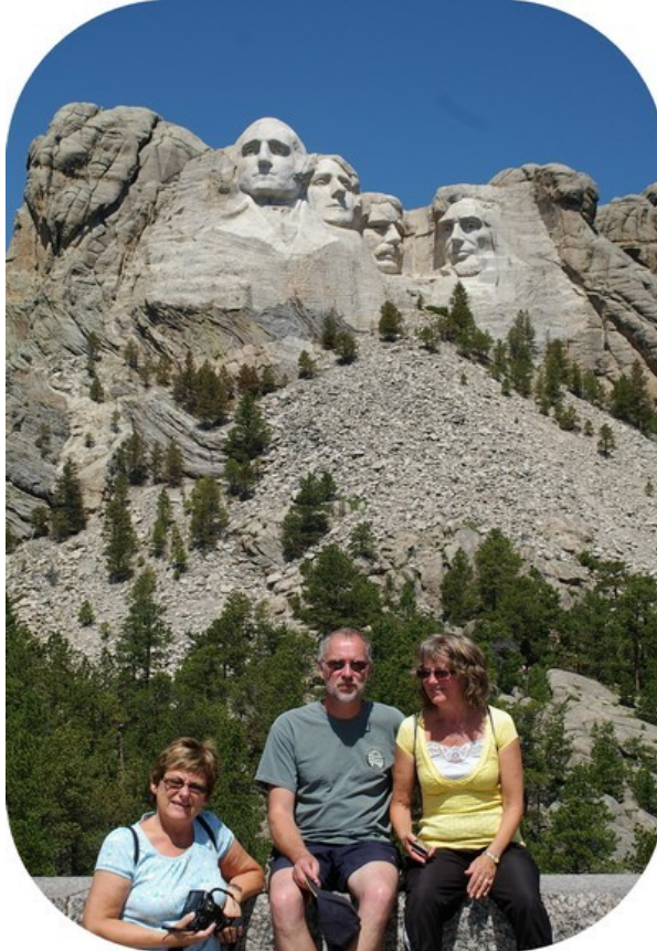
Præsidenthovederne og tre andre hoveder.

Vi måtte returnere grundet ovennævnte opmåling og vælge en anden rute frem mod, i hvert fald for mig, en af turens store højdepunkter, de 4 præsidenthoveder ved Mount Rushmore. Den sidste del af vejen dertil går gennem 3 tunneller, hvoraf den sidste byder på direkte udsigt til hovederne. Vi lavede selvfølgelig et fotostop i tunnellen. Der var heldigvis ingen bag os, så vi fik et flot billede af hovederne med tunnellen som ramme. Den sidste mile kom vi ind på en større vej; vi havde indtil da nærmest kørt alene, men nu var der rigtig meget trafik, ja – og alle de andre biler skulle samme sted hen som os. Det er åbenbart en kæmpe turistattraktion; vi holdt i kø ved indgangen til parkeringshusene i 4 rækker, og det tog os nok et kvarters tid at komme ind og stille bilen.