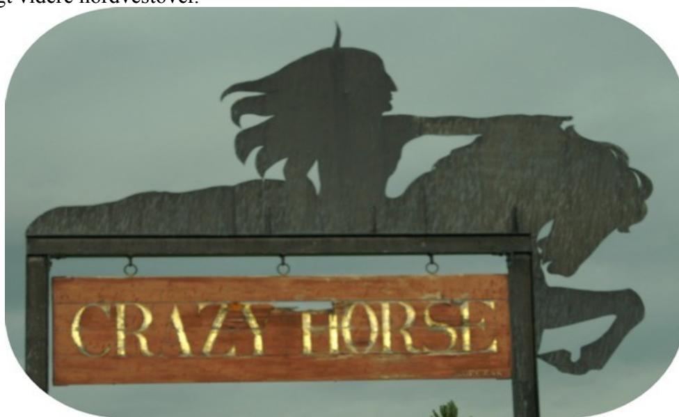
Crazy Horse, sådan kommer den formentlig til at se ud om føje år.

Indianerhøvdingen Crazy Horse ledede sammen med Sitting Bull flere kampe mod kavaleriet, blandt andet det berømte slag ved Little Big Horn, hvor general Custer og alle hans mænd blev dræbt. Crazy Horse skulpturen er planlagt til at blive 172 meter højt og 195 meter langt. Vi tog billeder af monumentet på afstand, tiden er ifølge vores planlægning ved at være fremskredet, vi måtte hastigt videre nordvestover.