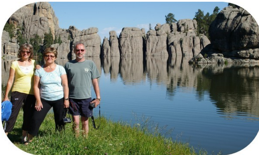
Den billedskønne Sylvan Lake.

Vi kørte fra KOA camperpladsen i Custer ved halv ni-tiden. Da vi ankom til Custer State Park, blev vi gjort opmærksomme på, at vognens bredde måske ville være et større problem. Damen ved indgangen udleverede en lang målepind til os, og så var det klart, at den del af rundturen som foregår på Needless Highway, en smuk vej langs høje klippespir, måtte udelades, da vores camper var for bred. Men vi kunne da lige køre ind og se Sylvan Lake, en sø som ligger meget smukt mellem de buttede klipper. Vi tog lidt billeder ved søens næsten blanke vand.