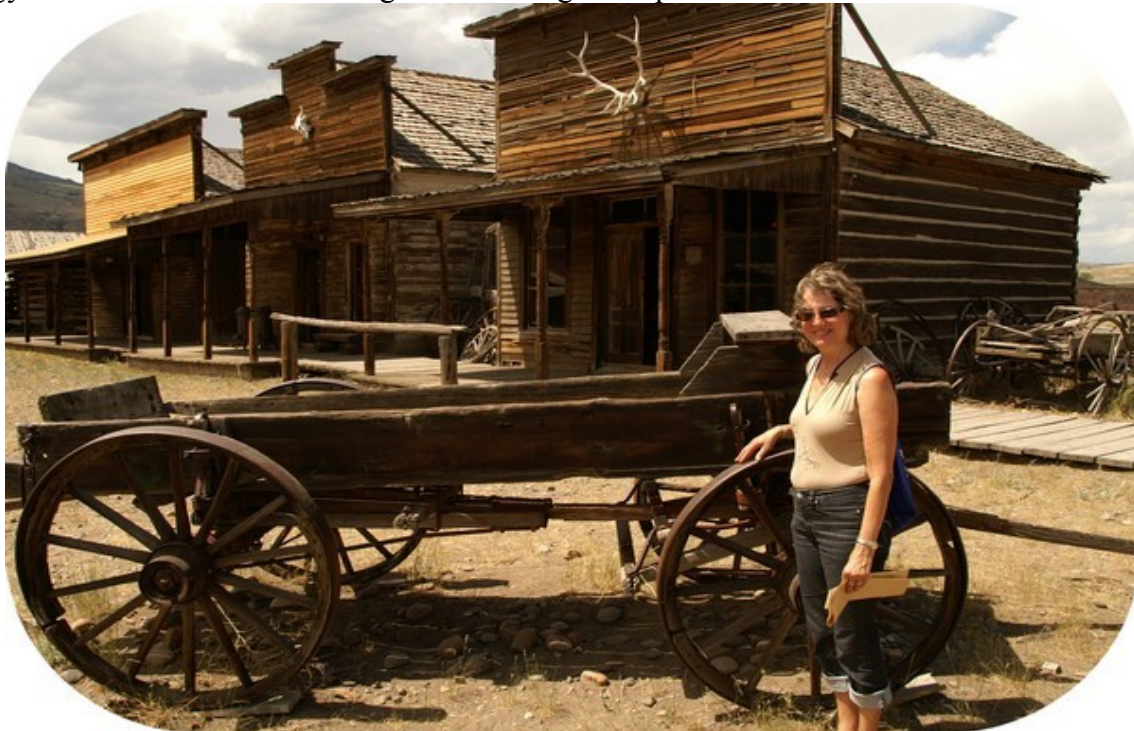
Den gamle by, Cody.

påbegyndt i 1967. Der er 26 huse og 100 hestevogne fra perioden 1879 til 1901.