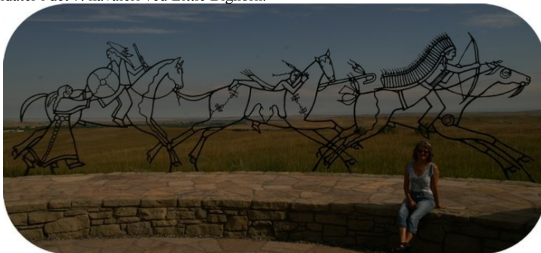
Ved indianernes mindesplads ved Little Big Horn.

Med høvdingene Sitting Bull og Crazy Horse i spidsen gik indianerne til angreb mod de hvides forsøg på at placere indianerne i stadig mindre reservater, og i 1876 udslettede de general Custer og hans soldater i det 7. kavaleri ved Little Bighorn.