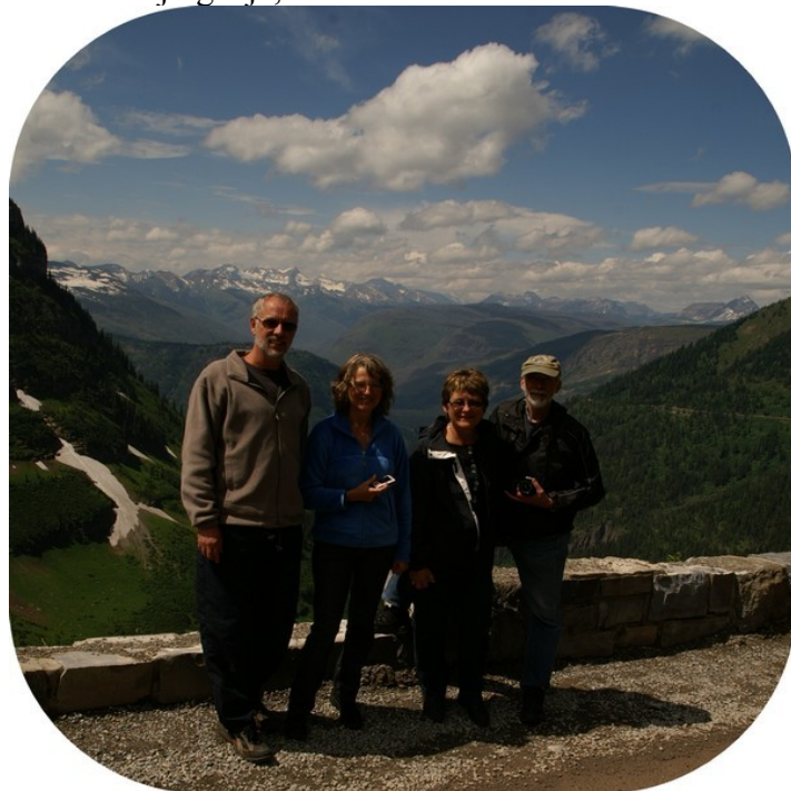
Glacier Nationalpark, vejret blev godt undervejs.

Glacier NP ligger både i USA og Canada, men da vi var ca. 40 miles fra Canada, var det kun den amerikanske del, vi besøgte. Det er den unikke kombination af bjerge, søer, skov og dyreliv, der gør Glacier National Park til noget helt særligt. I Glacier mødes flere forskellige typer natur, og det giver nogle meget unikke naturoplevelse inden for relativt kort afstand. Parkens eneste gennemgående vej, Going-to-the-Sun Road, går øst-vest og har en længde på 80 kilometer. Vejen er en af verdens mest spektakulære bjergveje, men er kun åben om sommeren.