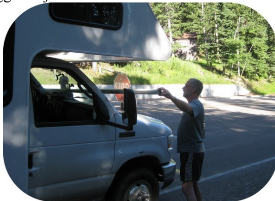
Opmåling af Camper.

Vi undersøgte bilen for oplysninger om højde i dag. Ingen af de papirer, som var med vognen, hjalp os, ej heller de mange advarselsskilte vognen er overklisteret med. Vi skulle kende vognens højde, fordi området rundt om Mt. Rushmore er spækket med tunneler, og ifølge vores kort er disse ganske små af størrelse. Ved hjælp af strikkeafdelingens centimetermål og et havebord lykkedes det os at opgøre højden til 3,2 meter eller 10,7 fod. En af tunnelerne måler kun 10,2 fod, så det var klart at vores rundtur skulle planlægges nøje.