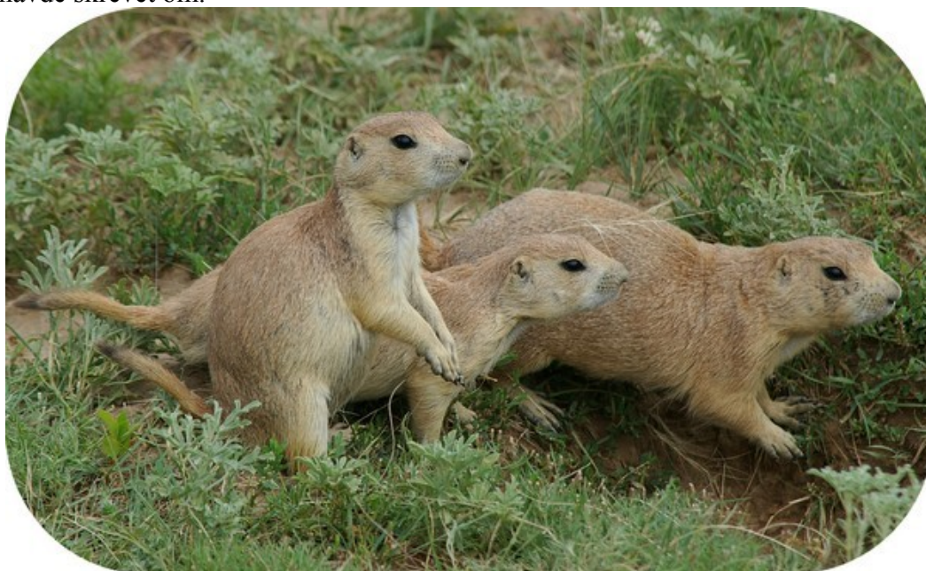
Præriehunde ved Devils Tower.